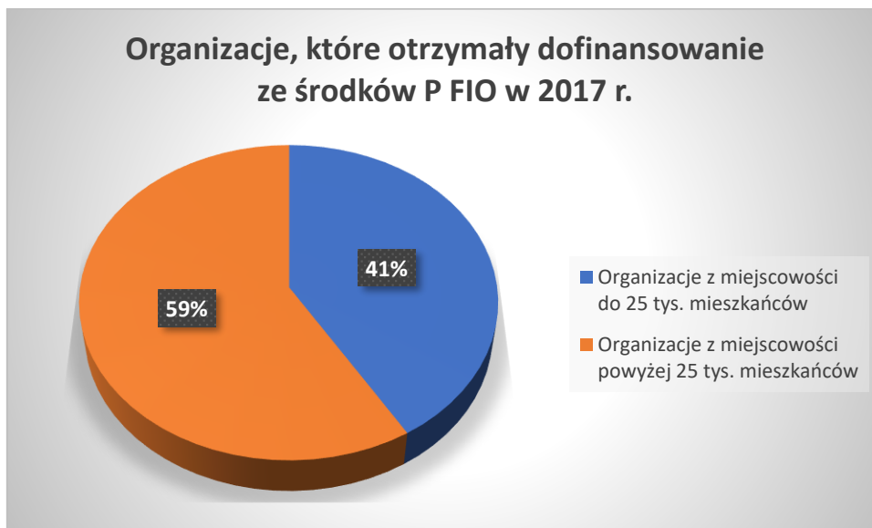
Wykres nr 4 Procentowy udział organizacji zarejestrowanych w gminach do 25 tys. mieszkańców wśród organizacji, które otrzymały dofinansowanie ze środków P FIO w roku 2017