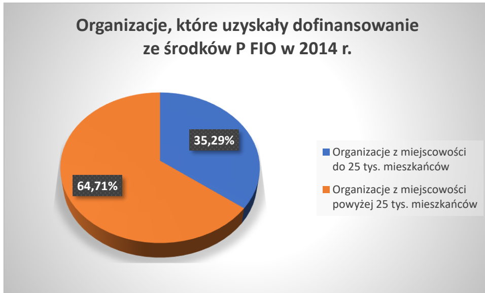
Wykres nr 3 Procentowy udział organizacji zarejestrowanych w gminach do 25 tys. mieszkańców wśród organizacji, które otrzymały dofinansowanie ze środków P FIO w roku 2014