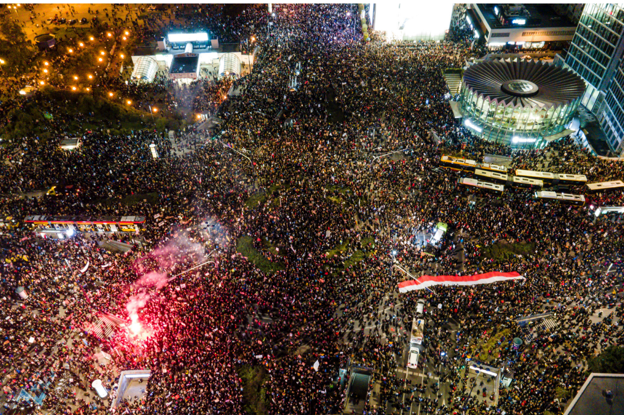
Warszawa, 30 października 2020. Marsz w ramach protestu przeciwko zaostrzeniu prawa aborcyjnego