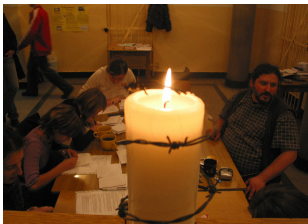
Zabrze, 11 grudnia 2004. Maraton pisania listów Amnesty International

1 stycznia. Dzięki ustawie o działalności pożytku publicznego i o wolontariacie obywatele po raz pierwszy mogą oddać 1% podatku dochodowego na rzecz wybranej przez siebie organizacji pożytku publicznego. Trzy lata później podatek można przeznaczyć na pomoc osobom prywatnym, mającym założone subkonto w ramach fundacji. Liczba podatników decydujących się na przekazanie podatku wzrasta z 80 tysięcy na początku do prawie 16 milionów po 18 latach.