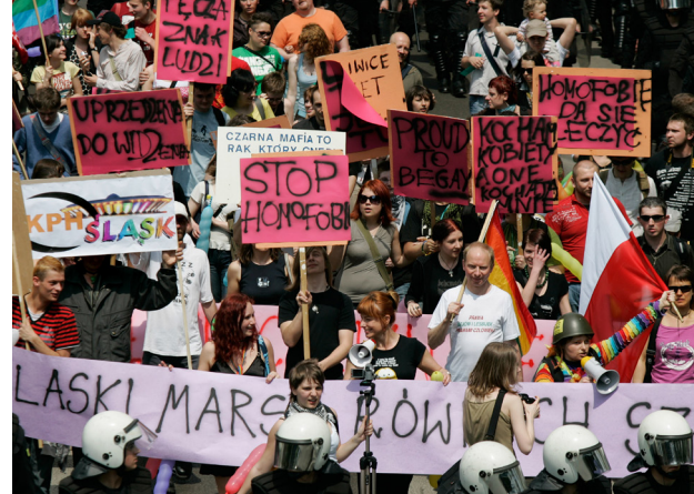
Katowice, 17 maja 2008. Pierwszy Śląski Marsz Równych Szans

1 maja. Polska przystępuje do Unii Europejskiej. W ciągu dwóch dekad ponad 15 tysięcy projektów polskich organizacji pozarządowych zostaje dofinansowanych łączną kwotą 261 miliardów euro. Dziś co dziesiąta organizacja ma w swoim budżecie pieniądze pochodzące z UE.