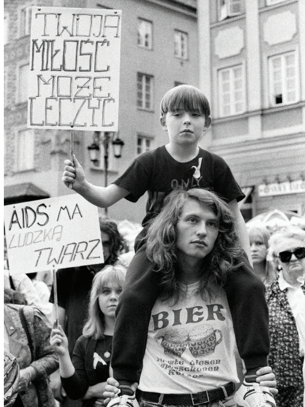
Warszawa, maj 1992. Zorganizowana przez MONAR manifestacja solidarności z chorymi na AIDS.

26 grudnia. Polski oddział Fundacji EquiLibre wysłał pierwszy konwój z darami do obłądanego Sarajewa. W ciągu następnych lat polski oddział usamodzielnia się i kontynuuje działalność jako